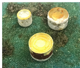
図1. 経年劣化したLiI:Euシンチレーターの 外観

9.11 事件以降、欧米を中心とした核テロ対策におけるプルトニウム検知を目的とした中性子検出器の国境、空港、湾岸への大量配備により、希少な 3 He資源の不足が顕在化し、 3 He ガス比例計数管に代わる中性子検出器の開発が喫緊の課題となっている。 3 He 代替の本命は無機固体シンチレーターを用いた検出器と考えられており、高性能な材料の探索が行われている。シンチレーターは放射線の照射により発光する材料で、光検出器と組み合わせることで放射線検出器として用いる事ができる。中性子シンチレーターは、 6 Li と中性子の核反応で生成する粒子線のエネルギーにより発光する。従って高濃度に 6 Li 元素を含有する必要があるが、リチウム化合物は潮解性や水との反応性を有するものが多く、従来の代替候補材料の報告は LiI:Eu (図 1)、Cs 2 LiYCl 6 :Ce など長期の安定利用に適さない、激しい潮解性を持つ化学組成が中心であり、潮解性のない材料の開発が求められていた。そのような状況のもと、本研究代表者らは潮解性がない新規中性子シンチレーターとして LiCaAlF 6 (LiCAF):Eu 単結晶(引用文献、 )を開発してきた。本材料は、中性子照射時に高い発光量を有し、大型単結晶の作製が可能で優れていたが、誤検出の原因となるガンマ線に対する感度が高い点や、単結晶製造プロセスが長時間を要することに由来する製造コストの高さの点で改善が必要であった。