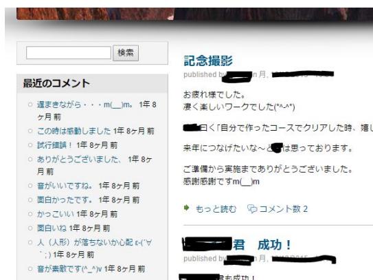
図 3.プロトタイプ利用時の画面（一部）

実験中、および実験後には適宜インタビューを行い、実験から得られる知見（研究者らの観測による知見や、保護者や被験者らから得られたフィードバック）等に基づき、SNS に対する要件獲得を継続的に実施した。