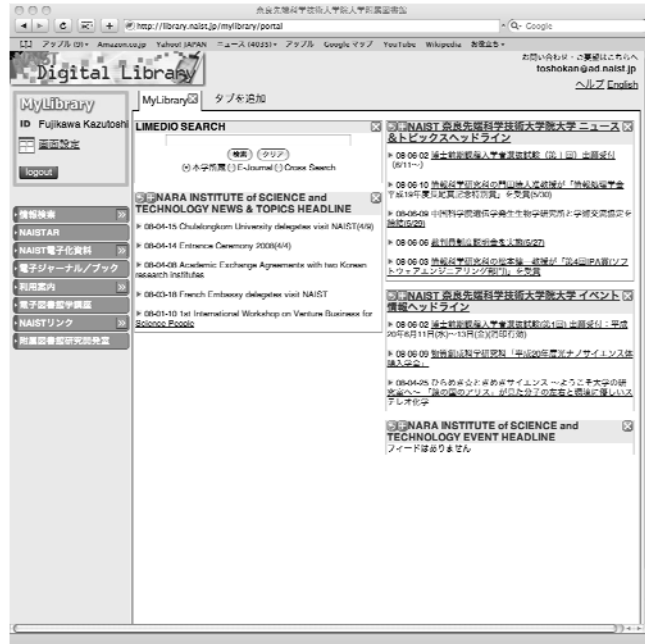
図 1: NAIST 電子図書館 ポータル画面