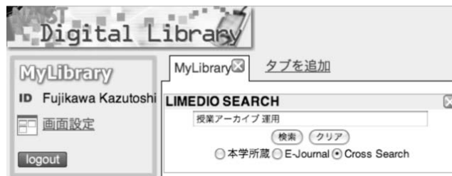
図 2: 検索キーワードの入力