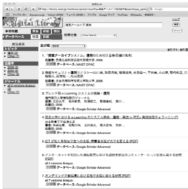
図 3: 検索結果