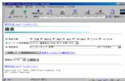
(b) Specify "Keywords"