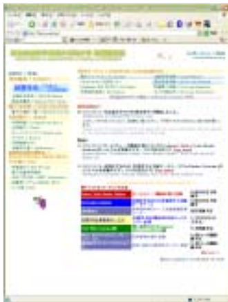
(a) Home Page http://dlw3.naist.jp

これ以外に、新着図書の中から利用者が登録したキーワードを含むものがあった場合、それを電子メールで知らせるサービスも提供されている。電子メールには文献名とともにそれにアクセスするための URL が含まれているため、通常はこれをクリックするだけで Web ブラウザが起動され該当する一次情報を参照できるようになっている。