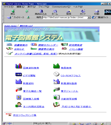
(a) Home Page http://dlw3.aist-nara.ac.jp

これ以外に、新着図書の中から利用者が登録したキーワードを含むものがあった場合、それを電子メールで知らせるサービスも提供されている。電子メールには文献名とともにそれにアクセスするための URL が含まれているため、通常はこれをクリックするだけで Web ブラウザが起動され該当する一次情報を参照できるようになっている。