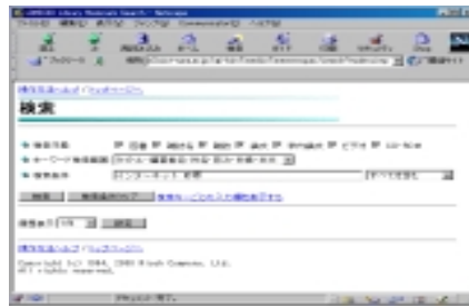
(b) Specify “Keywords”